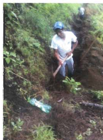
(foto 11 y 12) Establecimiento de estructuras de conservación 2015.