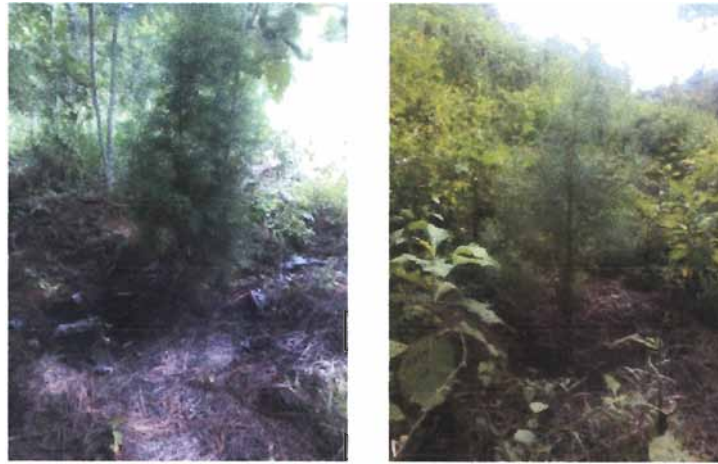
(foto 3 y 4 ) Mantenimiento de reforestación, planta de Cipres y Pino

Durante el presente año, se establecieron 14.7 hectáreas de reforestación con las especies: ciprés ( Cupresus lucitanica ), Pino ( Pinus oocarpa ), Palo blanco ( Cybistax dennel smithii ), Matiliguat ( Tabebuia rosea ), Níspero de montaña ( Pouteria glomerata ), Encino ( Quercus sp. ), a un distanciamiento de 3x3 al tresbolillo manteniendo una densidad de 1,111 plantas por hectárea, las cuales tienen un prendimiento de 85 % a la fecha, con buenas condiciones de salud, durante este período de verano solamente se monitorea la humedad del suelo y se enfoca en al protección de las reforestaciones.